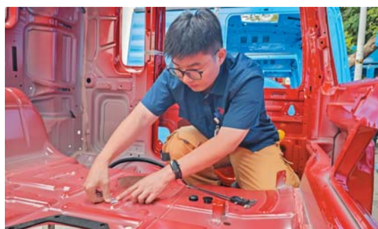
组重点围绕装配质量和客户体验感提升展开项目革新,严格按照工艺要求,理清各类车型状况与不同品牌的实际差异,展开现场测试。根据测试情况,他们重

为有效提升驾驶室清洁状况与稳定,济南卡车制造公司总装二部组织技术人员开展课题攻关。攻关小